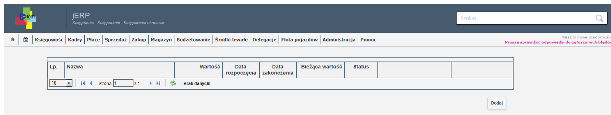
Ilustracja 1: Lista konfiguracji rozliczeń międzyokresowych

W celu skonfigurowania rozliczeń międzyokresowych należy przejść do zakładki Księgowość → Księgowanie → Księgowania międzyokresowe . Po przeładowaniu strony zostanie wyświetlona lista przygotowanych konfiguracji rozliczeń międzyokresowych.